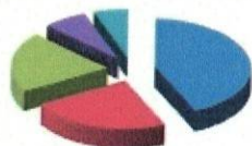
Numărul de cazuri la nivel de spital pe grupe de diagnostic - anul 2024